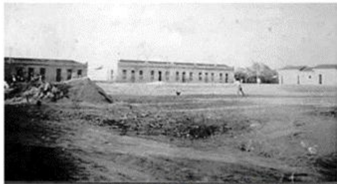
Construcción del Parque, década de 1930, Bblca Deptal