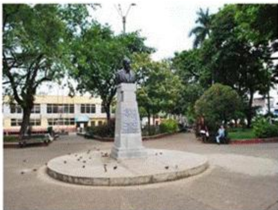
Busto del General ecuatoriano Eloy Alfaro Delgado