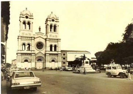
Parque de San Nicolás, década de 1960

El barrio San Nicolás se conoció inicialmente como el Vallano por su planicie y en él habitaban los peones y pulperos en casas de bahareque y paja, cuando la clase pudiente habitaba en el Empedrado o altozano , piedemonte de la aldea. Cali hacía parte de la Arquidiócesis de Popayán, y la antigua capilla de adobe dedicada a San Nicolás de Bari, iniciada en 1770 frente a la plaza, fue erigida como parroquia en 1848 segregándola del curato de San Pedro, dándole como límite la actual calle 13. El nuevo templo iniciado en 1880 se terminó en 1926, tras la demolición de la vieja capilla averiada con el terremoto y sus torres se culminaron en 1946. Desde su creación se venera allí el Cristo de la buena muerte .