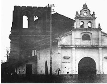
Antigua Capilla y nueva Iglesia de San Nicolás, ca. 1920.