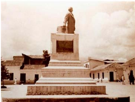
Estatua del prócer caleño Dr. Ignacio de Herrera y Vergara, ca. 1940