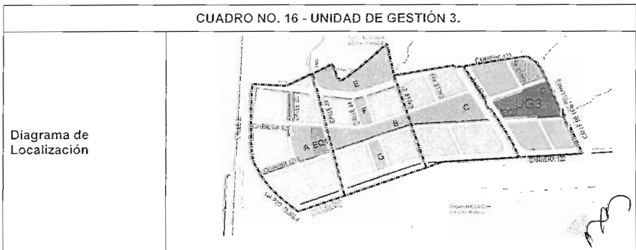
CUADRO NO. 16 - UNIDAD DE GESTIÓN 3.